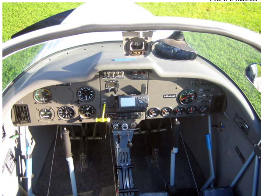
Interiör från Samburo, där man sitter sida vid sida