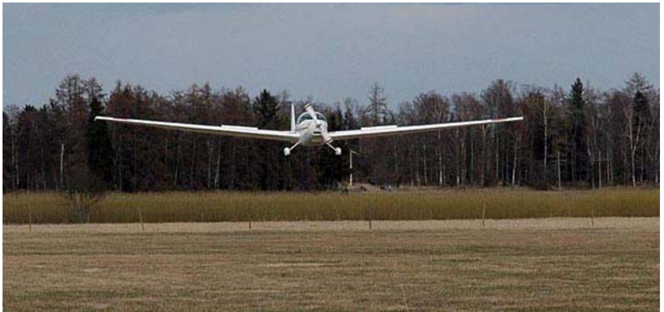
Samburo landar på Sundbro

Sist men inte minst så får du en massa nya trevliga vänner att umgås med när du kommer ut på fältet och vi har väldigt roligt, och det kostar ju inget som tur är.