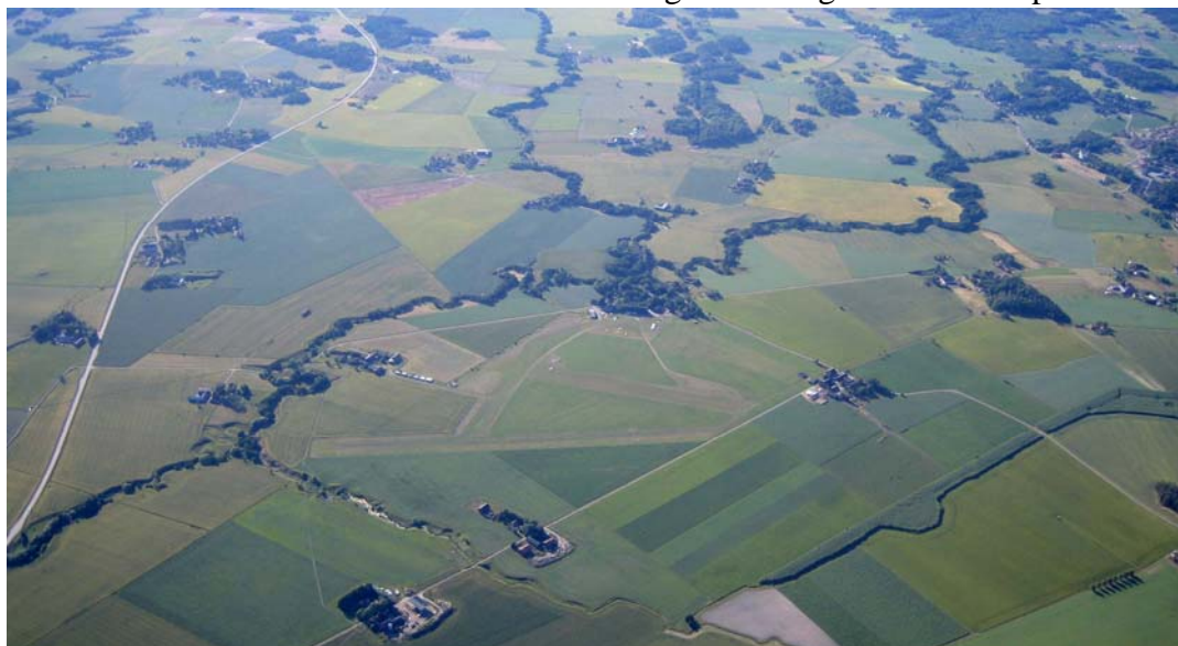
Foto: Sundbro från ovan, taget från Uppsala sidan och norrut (Gysingevägen till vänster)

Har du funderingar kring detta så hör gärna av dig till vår skolchef så får du veta mer. Det gäller om du vill utbilda dig från segelcertifikat till motorseglarbehörighet alternativt från A-certifikat eller ultralätt certifikat till motorseglar behörighet som exempel.