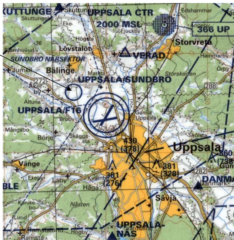
Flygkarta över Uppsala/Sundbro

Åk väg 272 från Uppsala mot Gysinge Sväng av mot Sundbro åt höger, skylt flygplats 1 Ni kan inte missa oss för ni kommer att se fältet. Alt, gamla E4, sväng av vid Svista värdshus och åk därefter rakt fram till ni kommer till flygplatsen Gratis parkering finns